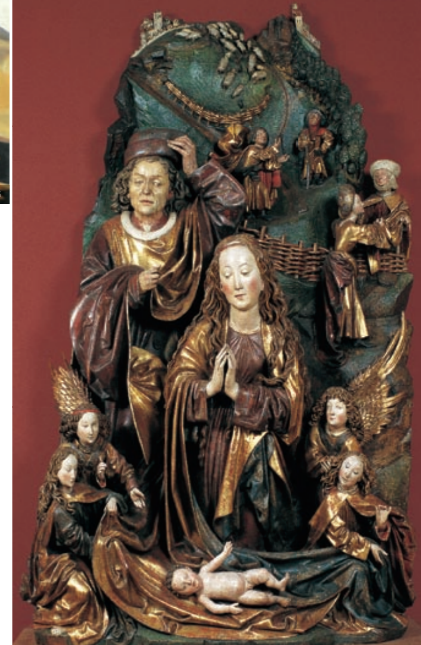
Neznámy bratislavský alebo viedenský sochár: Narodenie Krista z Dómu sv. Martina v Bratislave (tiež zv. „z Hlohovca“). Okolo 1480. Majetok SNG

Koncepcia odbornej práce galérie a jej kultúrnych aktivít sa formovala a ujasňovala dlhší čas. Využívali sa pritom vzory a príklady zo zahraničia, vplyv domácich kultúrnych tradícií a formoval sa aj jej zberateľský, výstavný, bádateľský, ochranný, kultúrno-výchovný a prezentačný program. Slovenská národná galéria dnes vlastní vyše 60-tisíc obrazov, sôch, grafických listov, kresieb, ilustrácií, tapisérií, plagátov, keramických diel, skla, umeleckých fotografií, scénografických návrhov, architektonických projektov, trojrozmerných objektov atď. Má vysunuté pracoviská aj na Zvolenskom zámku, v kaštieli v Strážkach, Galérii inšitného umenia v Pezinku a Galérii Ľ. Fullu v Ružomberku. Návštevníkom poskytuje široký diapazón služieb (od lektorských výkladov, animačných programov, tvorivých dielní, odborných prednášok, besied až po filmové projekcie, operné podvečery a iné sprievodné podujatia k výstavám). V jubilejný rok je výstavný plán SNG obohatený o niekoľko netradičných projektov, ktoré budú prebiehať na všetkých jej pracoviskách. Nosnými podujatiami budú dva výstavné a zároveň edičné projekty: 111 diel zo SNG a 60 rokov otvorené . Prvý predstaví