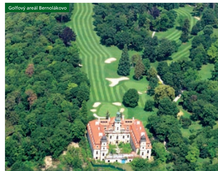
Golfový areál Bernolákovo