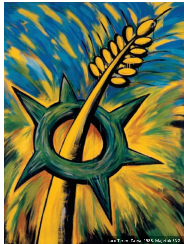
Laco Teren: Zatva. 1988. Majetok SNG

Galériu tvorí komplex budov s ústrednou dominantou – pôvodne štvorkrídlovou barokovou rezidenciou bývalej mestskej polície, situovanou na dunajskom nábřeží (odtiaľ pomenovanie Vodné kasárne) z rokov 1759 – 1763 (arch. G. B. Martinelli, F. A. Hillebrandt). Historická budova bola spočiatku adaptovaná pre SNG (1950 – 1955), neskôr rekonštruovaná a doplnená o prístavbu (1969 – 1977, arch. V. Dedeček) pre širšie potreby galerijnej inštitúcie. V roku 1990 SNG získala Esterháziho palác z druhej polovice 19. storočia v štýle neoslohu (staviteľ I. Feigler ml.). Po jeho rekonštrukcii, ukončenej v roku 1994 (arch. Ľ. Gáliková), rozšírila galéria svoje expozičné priestory. Tie slúžia na prezentáciu dočasných výstav či už zo Slovenska, alebo zo zahraničia.