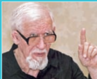
Rozhovor s Milanom Rúfusom