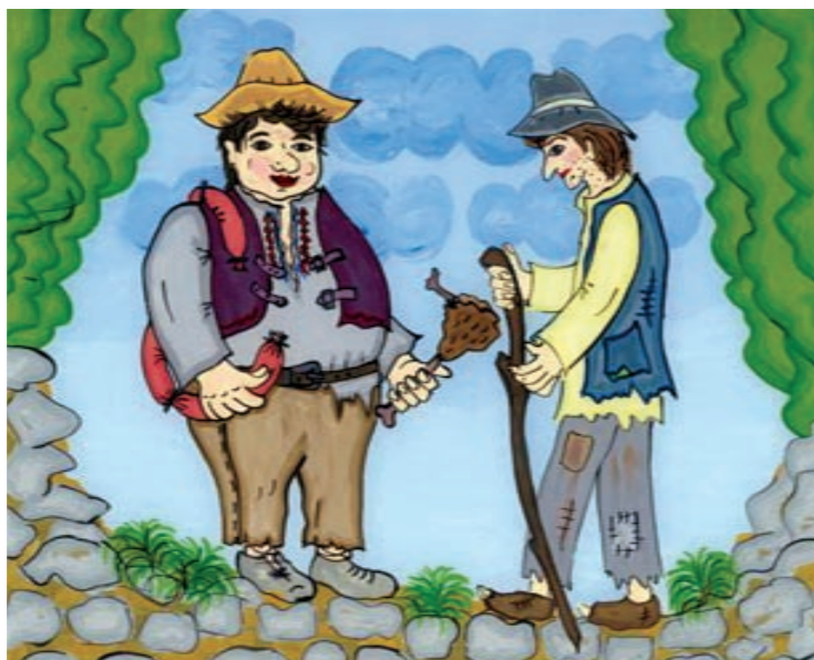
Autor malby na sklo: Lubomír Kolár