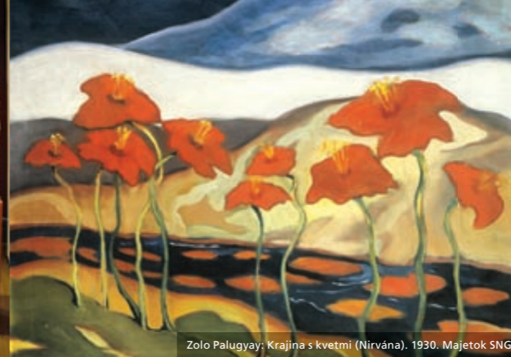
Zolo Palugyay: Krajina s kvetmi (Nirvána). 1930. Majetok SNG