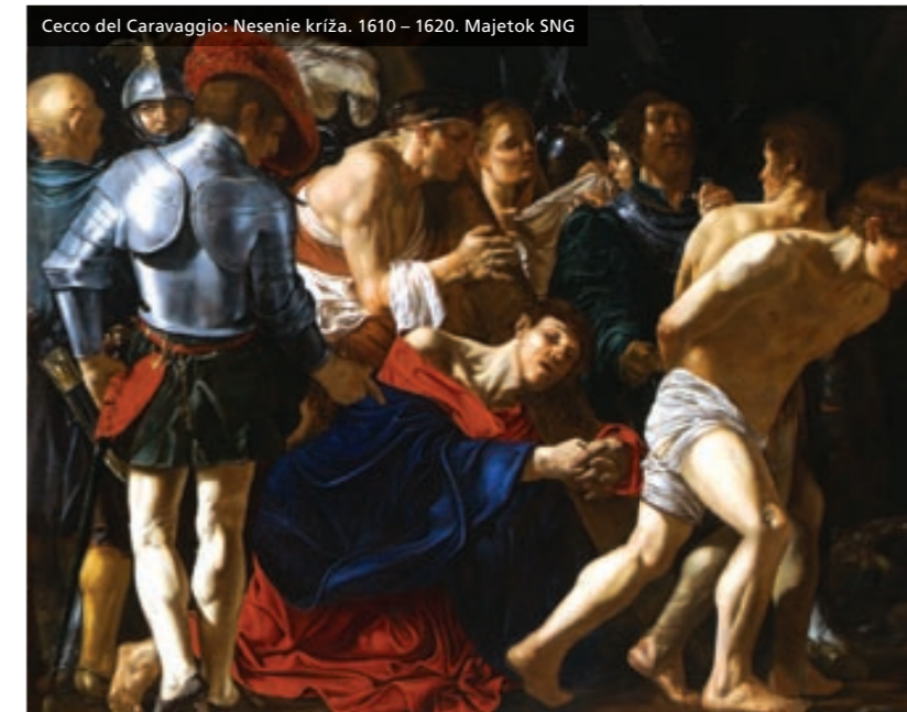
Cecco del Caravaggio: Nesenie kríža. 1610 – 1620. Majetok SNG