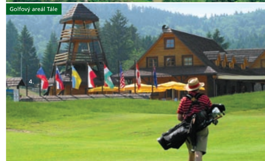
Golfový areál Tále