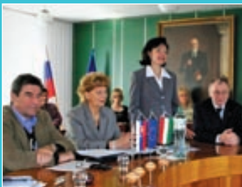
Martinská literárna jar