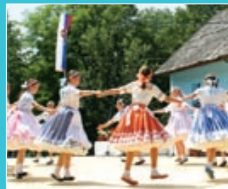
Slávnosti v Hložanoch