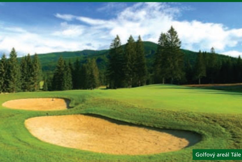
Golfový areál Tále

– SPA-GOLF KLUB, Golfový areál Black Stork Veľká Lomnica). Kluby stoja v popredí profesionálneho golfového života, ale starajú sa aj o golfovú dorast a organizujú školy golfu pre začiatočníkov. V porovnaní so zahraničnými golfovými klubmi s porovnateľnými službami a kvalitou sú náklady na hru na Slovensku niekoľkonásobne nižšie. Tak prečo nevyužiť skvelé slovenské možnosti?