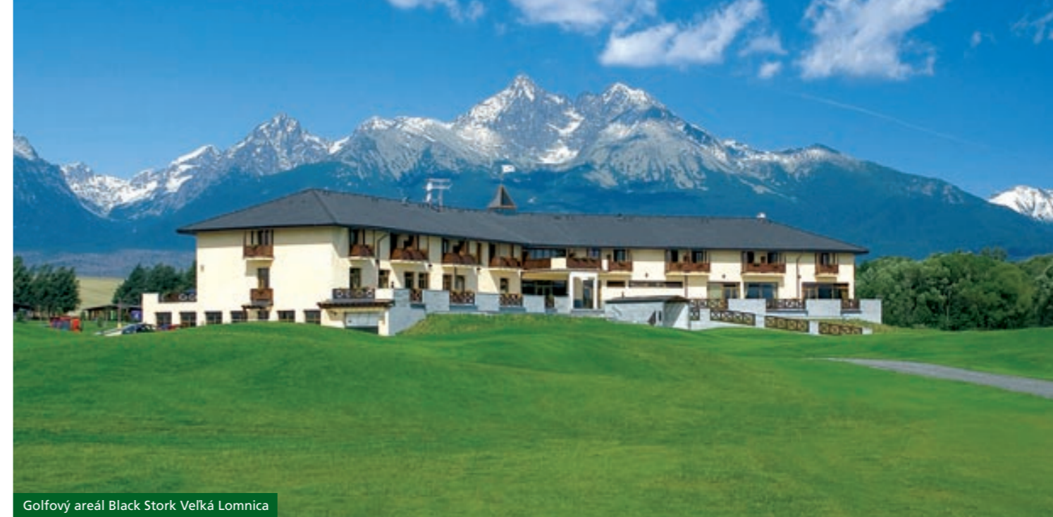
Golfový areál Black Stork Veľká Lomnica