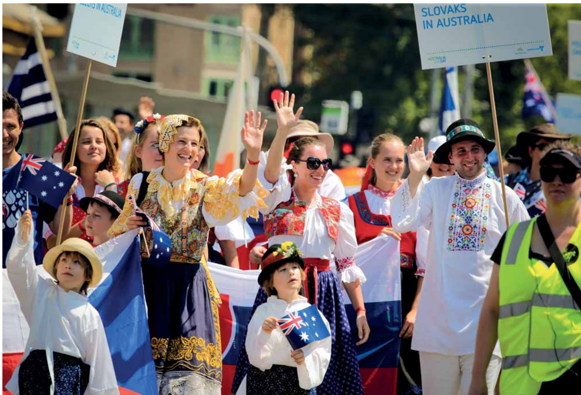
Australia Day, Melbourne – Austrália.

Slováci žijúci v Melbourne sa každoročne zúčastňujú na slávnostnom multikultúrnom sprievode mestom pre príležitosť osláv Dňa Austrálie. Spontánne, bezprostredne, vedno aj s Čechmi žijúcimi v Austrálii. Spoločná minulosť ich – čo je potešujúce – stále stmeluje a vzájomne povzbudzuje. Ved' aj žijú najďalej zo všetkých našich krajanov od ich materských štátov.