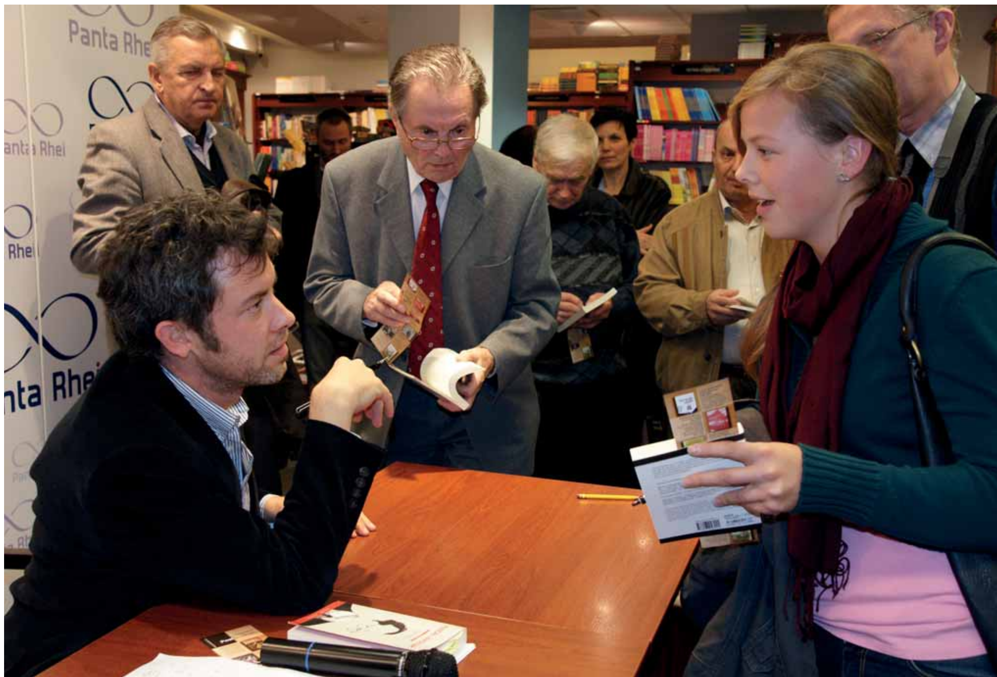
Neviditeľný, a predsa pôsobivý, Bratislava – Slovensko.