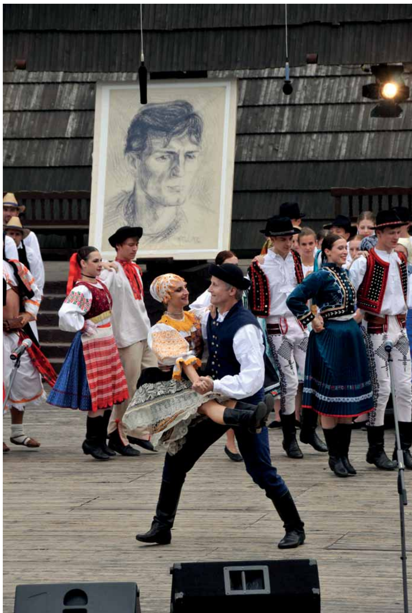
Prehni že ma cez kolienko..., Detva – Slovensko.