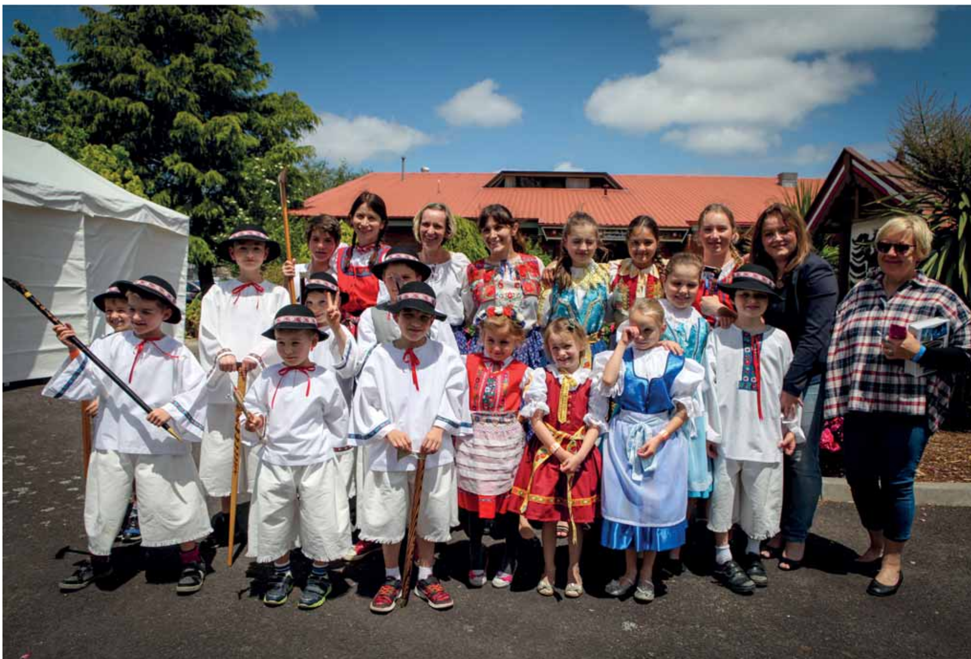
Spoločná, Melbourne – Austrália.

Spoločná fotografia detí a učiteliek z Detskej besedy v Melbourne po folklórnom vystúpení v rámci kultúrneho programu festivalu VODAFEST 2015 v Melbourne. Detská beseda – to je predovšetkým záslužná činnosť učiteliek a rodičov detí, aby ešte aj v najmladšej generácii zvučala v Austrálii lúbezná slovenčina.