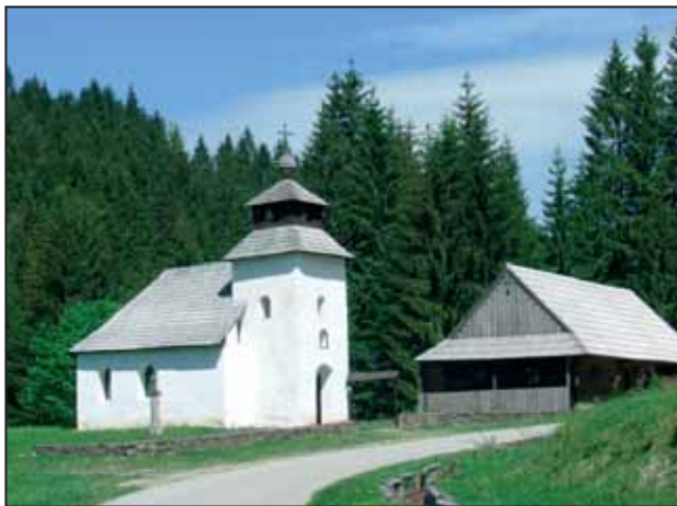
Kaplnka Panny Márie Ružencovej