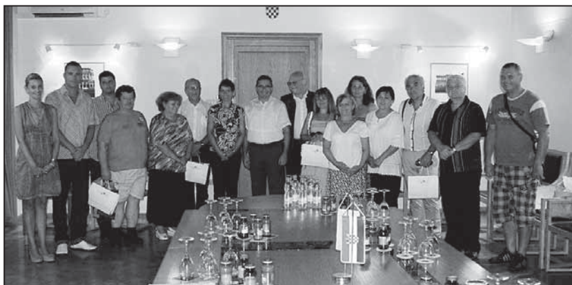
Členovia MS a hostia

Už zasa máme rok za sebou, o jeden rok sme bohatší, starší a skúsenejší. Vždy čakáme, že keď sa jeden rok skončí, druhý za ním urobí nejaký zázrak, že sa začína nejaký krajší, bezstarostnejší