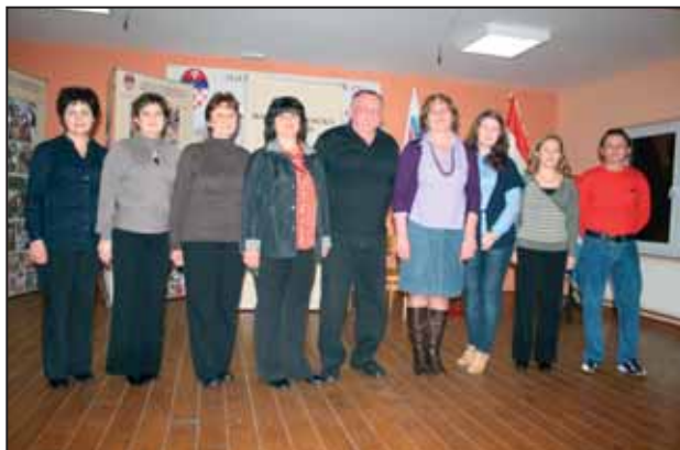
Výkonný výbor MS Mílevci