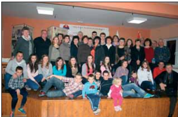
Maticári MS Mílevci