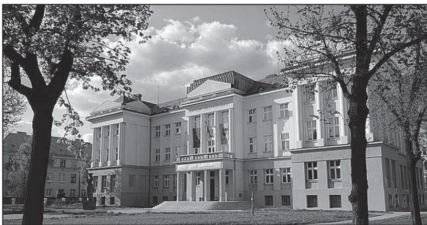
Budova Matice slovenskej

Rok 2013 je z viacerých aspektov slávnostný.