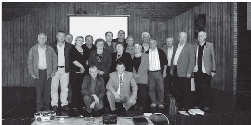
Členovia VV Zväzu Slovákov

MS Našice usilovne pracuje na organizácii Plesu Slovákov a priateľov, Našički Slováci svojmu mestu. Istotne sa nám predstaví aj niekoľkými výstavami počas roku. Zväzové valné zhromaždenie bude tohto roku koncom marca asi v Našičiach. Detská prehliadka slovenského folklóru bude 4. mája v Josipovci. Okrem toho maticári z Josipovca organizujú aj podujatie Slováci do Drlaku. V máji budú mať maliarsku kolóniu členovia MS Jurievec. Literárno-recitačnú prehliadku žiakov základných škôl bude mať na starosti ZŠ V. Nazora Nova Bukovica a MS Míľovce 11. mája. V októbri maticári z Míľoviec budú mať aj Dni kukurice. Prehliadka slovenského folklóru v Chorvátsku bude tohto roku v Rijeke začiatkom júna. No členovia MS Rijeke budú mať aj Dni slovenskej kultúry v Rijeke. Na Detve nás predstavia členovia MS Markovec, ktorí chystajú v septembri aj Večer poľsniakov. V Du-