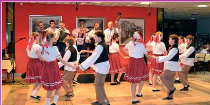
FS MS Markovec, detská skupina

Z bohatého folklórneho repertoáru SKUS-uFraňa Strapača bolo veľmi ťažko vybrať len asi desať choreografií pre tento folklórny večierok. Vedúci ta-