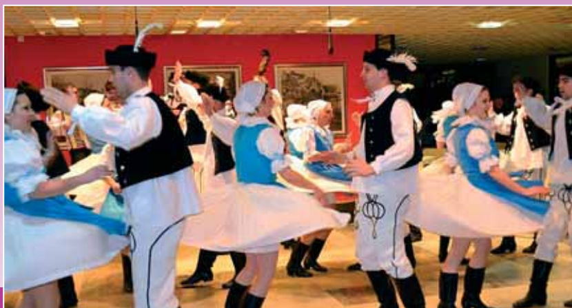
FS MS Markovec

Počúvajte vysielanie po slovensky Rádía Osijek každú nedeľu o 19.40 Počúvajte vysielanie po slovensky Rádía Našice každú stredu o 18.15 Počúvajte vysielanie po slovensky Rádía Đakovo každý utorok o 19.30 Počúvajte vysielanie po slovensky Rádía Ilok každú sobotu o 12.00 Počúvajte vysielanie po slovensky Rádía Slatina každú sobotu o 18.00