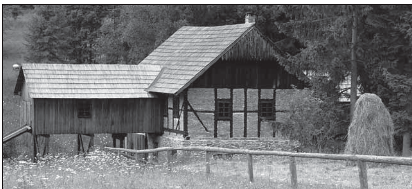
Mlyn a píla z Klubiny