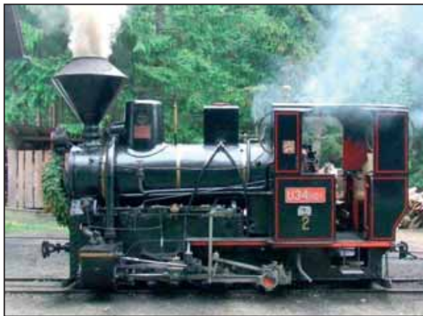
Historická lesná úvraťová železnica